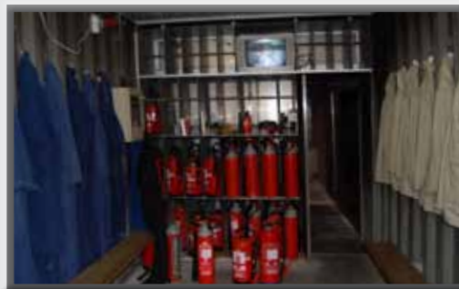
Formation à l'aide de l'unité mobile